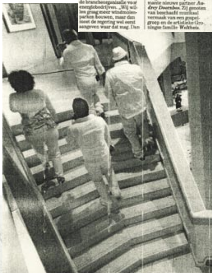
De gasten gaan voorafgegaan door een gospelkwartet naar de zaal in het Gasuniegebouw.