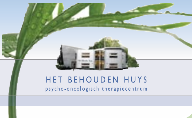
HET BEHOUDEN HUYS psycho-oncologisch therapiecentrum

N.V. Nederlandse Gasunie Gasterra Rabobank Dagblad van het Noorden Aan De Grote Markt 's Amuse / Sociëteit de Sleutel Seatrade Groningen Seaports Reisbureau Internoord Adtentie reclame